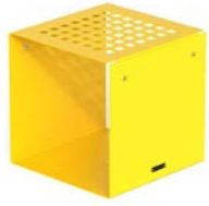
CUBIK - P