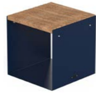
CUBIK - W