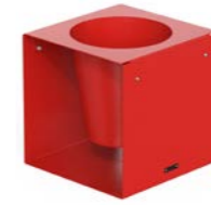
CUBIK - F