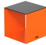
CUBIK - H