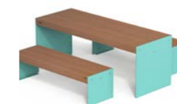
LENA TA W + LENA P W 1500