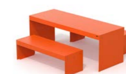
LENA TA M + LENA P M 1500

Table composée de deux supports en tôle d'acier, avec un dessus en lames de bois dur ou en lames de pin thermo-traité ou WPC, sur un cadre en tube d'acier et des pièces de jonction en tôle pliée. Une version avec un dessus en acier tubulaire est également disponible. Une paire de bancs Lena sans dossier L=1500 mm complète la collection. Toutes les parties métalliques sont galvanisées et thermolaquées en poudre de polyester thermodurcissable. Toute la visserie est en acier inoxydable AISI304. Predisposition avec des trous pour la fixation au sol avec des chevilles mécaniques (non incluses).