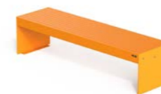
LENA P M

Bench without backrest composed of two steel sheet supports, with seat in hardwood or thermo-treated pine slats or WPC slats, on a tubular steel frame and folded steel sheet ribs. Also available in a version with a seating surface made of steel tubes. All metal parts are galvanised and coated with thermosetting polyester powder. All fixings are in AISI304 stainless steel. Prepared with holes for ground fixing through mechanical dowels (not included).