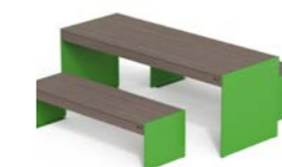
LENA TA WPC + LENA P WPC 1500