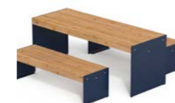
LENA TA TW + LENA P TW 1500

Table composed of two steel sheet supports and a table top in hardwood or thermo-treated pine or WPC slats, on a tubular steel frame and folded steel sheet ribs. Also available in a version with tabletop made of steel tubes. A pair of Lena benches without backrest L=1500 mm completes the collection. All metal parts are galvanised and coated with thermosetting polyester powder. All fixings are in AISI304 stainless steel. Prepared with holes for ground fixing through mechanical dowels (not included).