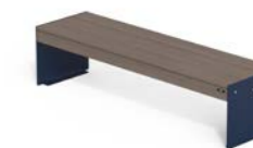
LENA P WPC

Banc sans dossier composé de deux supports en tôle d'acier, avec assise en lames de bois dur ou en lames de pin thermo-traité ou WPC, sur un cadre en tube d'acier et des pièces de jonction en tôle pliée. Une version avec une surface d'assise en acier tubulaire est également disponible. Toutes les parties métalliques sont galvanisées et thermolaquées en poudre de polyester thermodurcissable. Toute la visserie est en acier inoxydable AISI304. Prédiposition avec des trous pour la fixation au sol avec des chevilles mécaniques (non incluses).