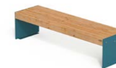
LENA P TW