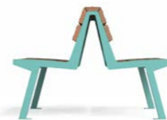
NOALE DOPPIA TWS