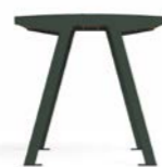
NOALE TA - TW