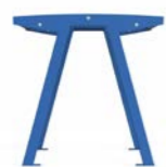
NOALE TA - M