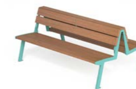
NOALE DOPPIA WS