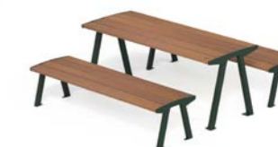
NOALE TA - W + NOALE WP

Table composée de structure et de supports en tôle d'acier et deux platines perforées pour la fixation au sol. Le dessus est composé de cinq lames de bois dur ou de pin thermo-traité ou d'acier. Toutes les parties métalliques sont galvanisées et thermolaquées en poudre de polyester thermodurcissable. Toute la visserie est en acier inoxydable AISI304. Prédisposition avec des trous pour la fixation au sol avec des chevilles mécaniques (non incluses).