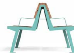
NOALE DOPPIA TWB