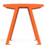
NOALE TA - W NOALE TA - TW