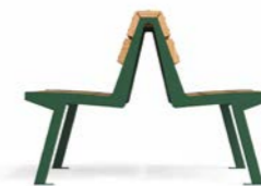
NOALE DOPPIA WS