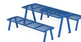
NOALE TA - M + NOALE MP