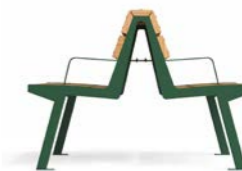
NOALE DOPPIA WB