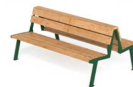
NOALE DOPPIA TWS