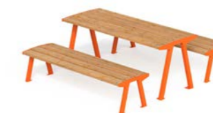
NOALE TA - TW + NOALE TWP